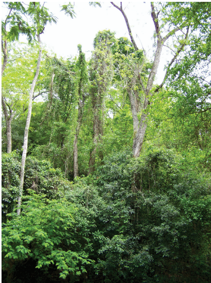
Imagen 6. El monte.

para curar, pero muy importante es el recuerdo de su utilización en la guerra contra los colonos ya que servía como escondite, hoy se dice que en ellos aún perduran las almas de los guerreros. ( Mburuvicha Flora Cruz)