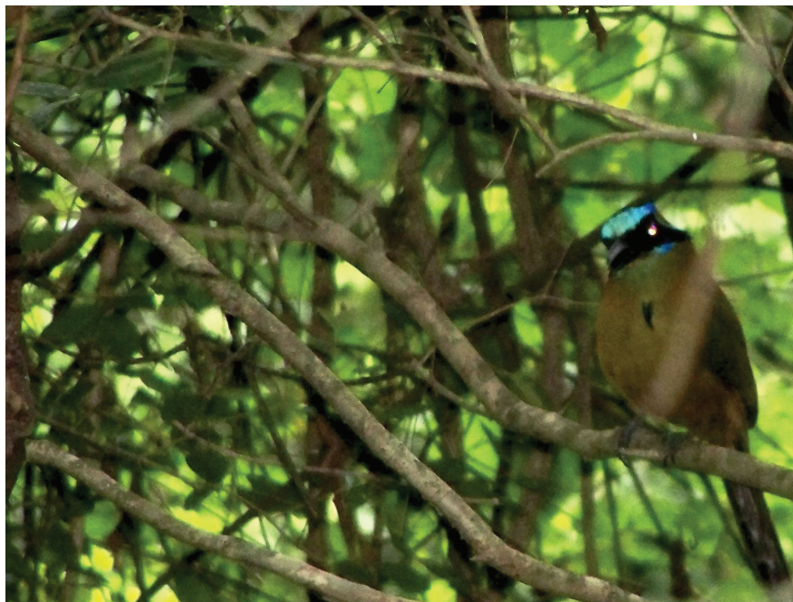
Imagen 3 y 4. Flora y fauna de ESG (fotografía proyecto ESG).