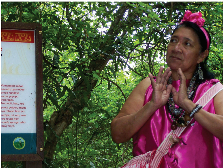
Imagen 7. Las mujeres guaraníes.