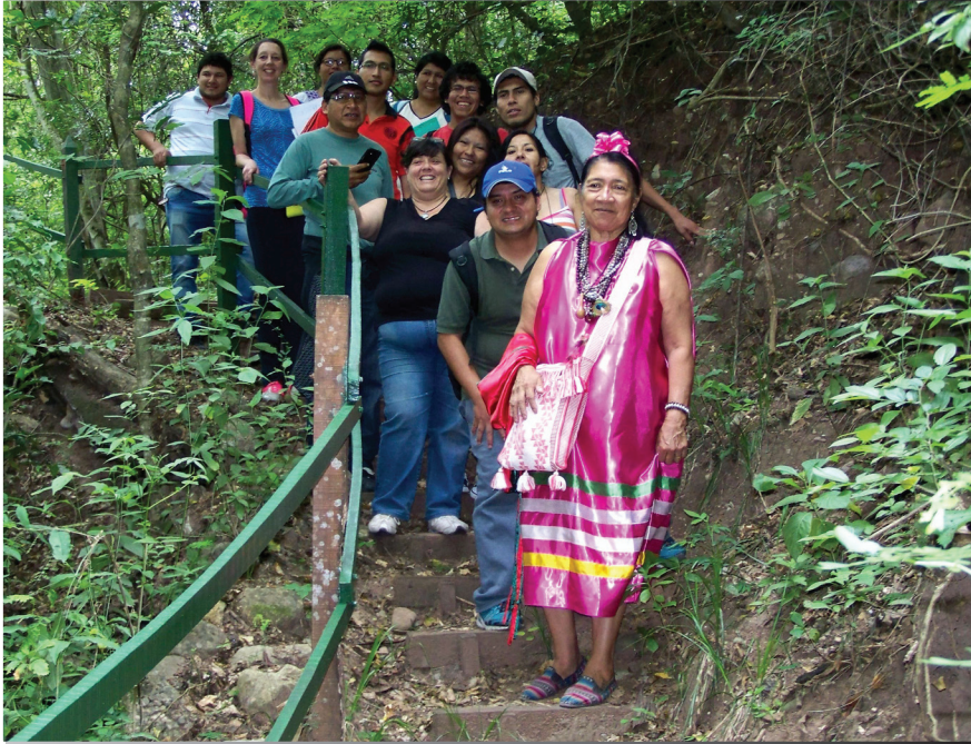
Imagen 1. Equipo de trabajo y guías guaraníes