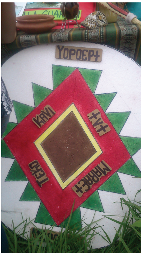
Imagen 2. El karakarapepo símbolo de la cosmovisión guaraní.

Las organizaciones políticas de los guaraníes, tanto a nivel comunidad como pueblo, son organizaciones con fuerte influencia de componentes políticos contemporáneos, de fuera de su grupo cultural de referencia, que fueron ajustadas a las mismas comunidades para poder formar parte de la estructura política estatal y gozar de los beneficios brindados por el Estado Nacional. A la vez es importante resaltar que las prácticas políticas responden a prácticas de ancestralidad que supieron adaptarse a la cultura política local por motivos de supervivencia. (Gutiérrez Guerrero, 2015, p. 167)