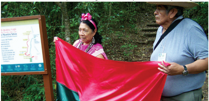
Imagen 5. Guiado empírico/profesional por relatos (fotografía proyecto ESG).

Así se realizó un registro de la información histórica que tuviera en cuenta la memoria social de la comunidad a partir de los relatos orales. Recopilación de información histórica sobre ESG por medio de los relatos populares, que no pretende fosilizar el conocimiento histórico del pueblo guaraní, sino ponerlo en evidencia científica, para cotejarlo con otras formas de conocimiento y transmisión de información histórica: la documental escrita y la del registro e interpretación arqueológica.