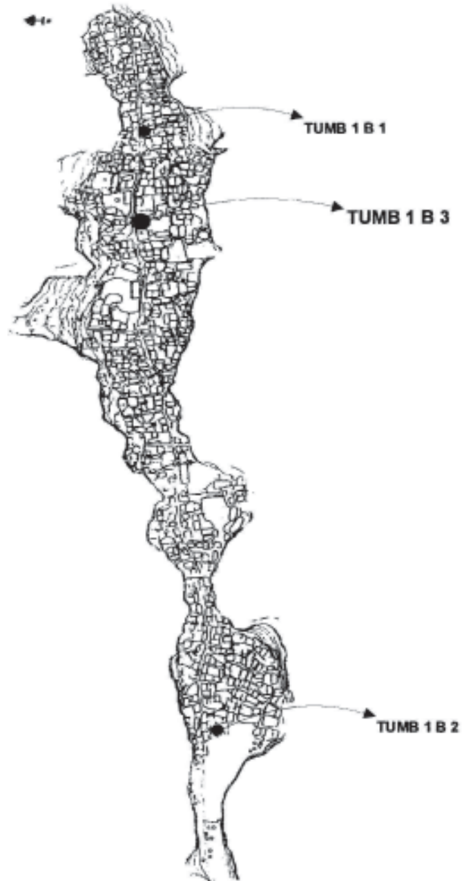
Figura 1. Plano del Pukará de Volcán. Ubicación de los basureros TUMB1B1 - TUM1B2 - TUMB1B3.