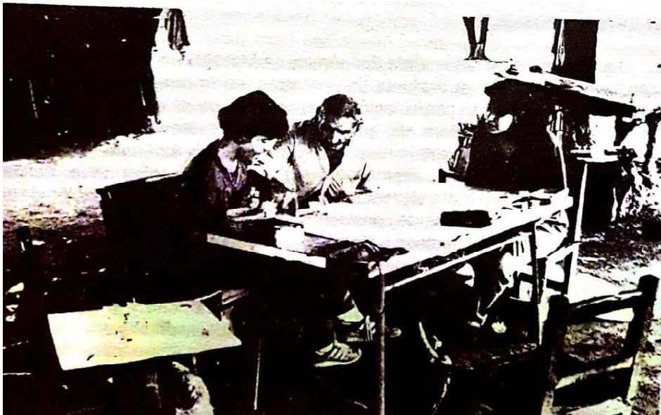
en la casa de la familia Abregú, Balderrama.